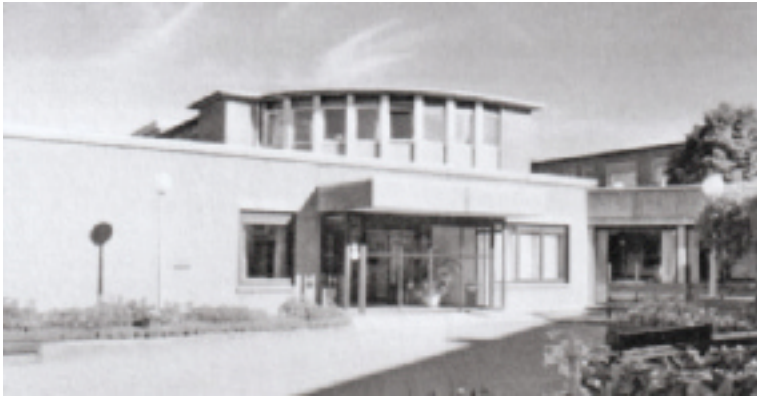
De 'oude' inkom