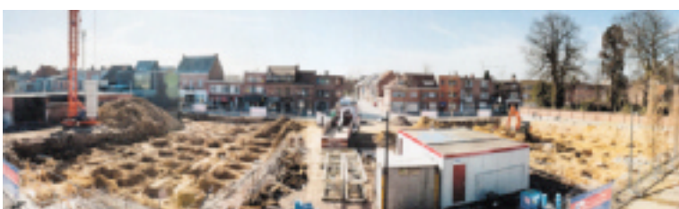
De bouwwerf van 'De Mantel'

Na de oorlog werden de beschadigde gebouwen hersteld. De meisjesschool werd erg geteisterd door de beschietingen van mei 1940 en de vliegende bommen tussen november 1944 en april 1945.