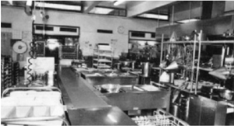
De 'oude' keuken