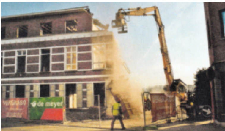
De afbraak van het klooster