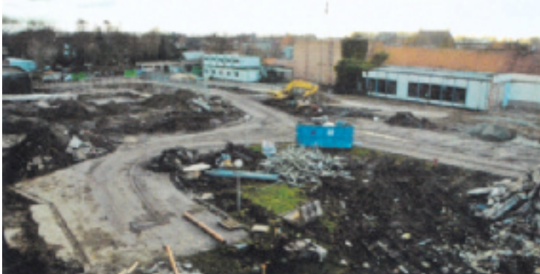
De bouwwerf van de 'nieuwe' Regenboog